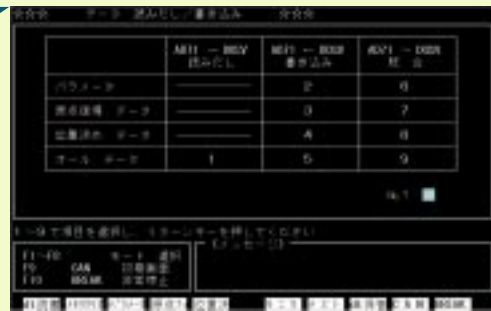
データメモリクリア