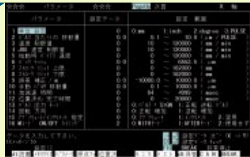
原点復帰データの読出・書込・修正