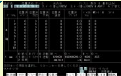
AD 7 1のモニタ